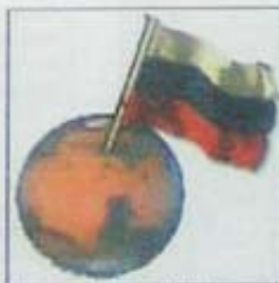
Rusos en Marte en 2011.

Los representantes rusos negaron rotundamente esa propuesta. La Agencia Espacial Rusa dijo que era un proyecto absurdo. Dicha agencia procurará buscar en empresas privadas los fondos necesarios para poder empezar ese maravilloso viaje.