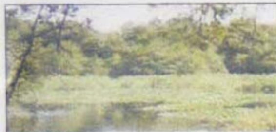
Riberas del Río Lagares