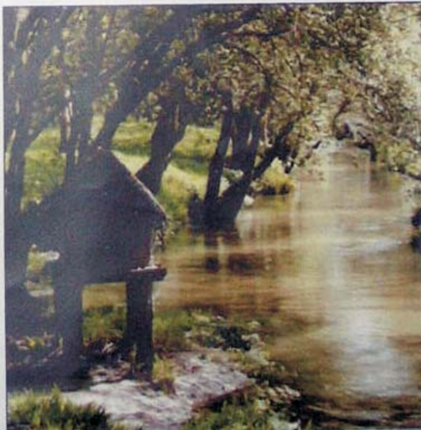
Riberas del Río Miñor

También, existen otros afectados parecidos al río Lagares. Por ejemplo la EDAR de Teis vierte directamente en la ría de Vigo todos los vertidos domésticos que producen varias zonas de su alrededor. Y como estas, muchas otras empresas más. Estos problemas van en aumento cada vez más y si nadie lo arregla es como destruimos a nosotros mismos. No pensemos solo en nosotros, sino también en nuestro planeta y en un futuro mejor para nuestros hijos.