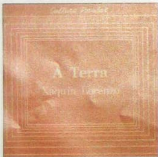
A Terra, uno de los trabajos etnográficos de Xocas.

En su recorrido por toda Galicia, recogió información necesaria para sus investigaciones de etnografía. Su condición de buen dibujante le da a sus trabajos un valor incalculable.