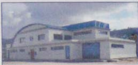
EDAR de Teis, Vigo